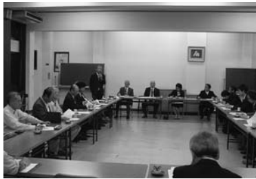
10月4日 第8グループ 於：東武クラブ