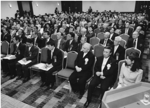
演奏に聞き入る出席者