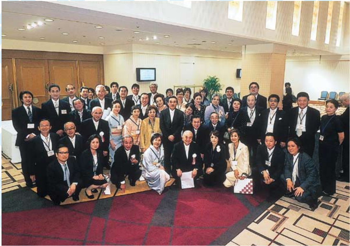
式典にお手伝いいただいた役員集合写真