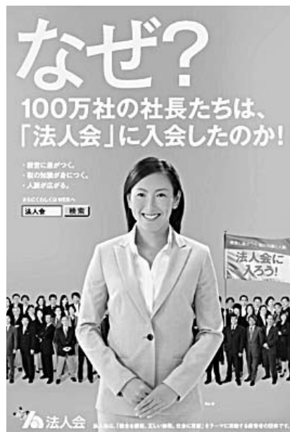
今年の法人会 会員増強 ポスター

今年も本格的な会員増強の時期になりました。近年本所法人会では、景気低迷の折りから会員の転廃業による退会が多く、会員数も減少しているのが現状です。会員一丸となって増強にご協力をお願い致します。お取引先等で未加入の法人がございましたら、加入勧奨をお願い申し上げます。(クオカード30000円分進呈) ご入会いただいた方にもクオカード30000円分進呈