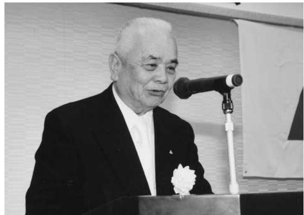
式辞を述べられる立岡会長