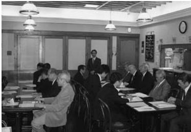
10月21日 第7グループ 於：パークカフェ