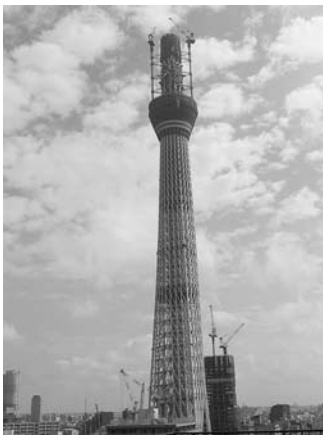
東京スカイツリー建設進捗状況シリーズ⑥ 10月7日撮影 488m