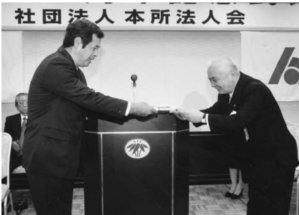
市川署長へイータックス横断幕目録贈呈