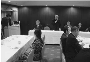
11月5日 第1グループ 於：ザ・ホテルベルグランデ