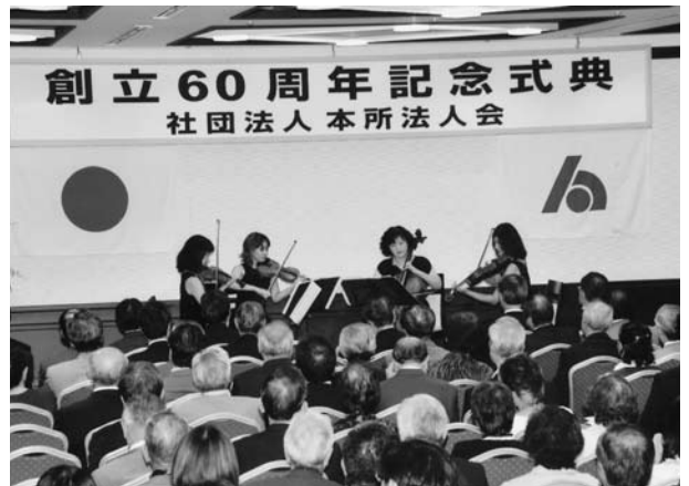
第一部 新日本フィルハーモニー交響楽団弦楽四重奏