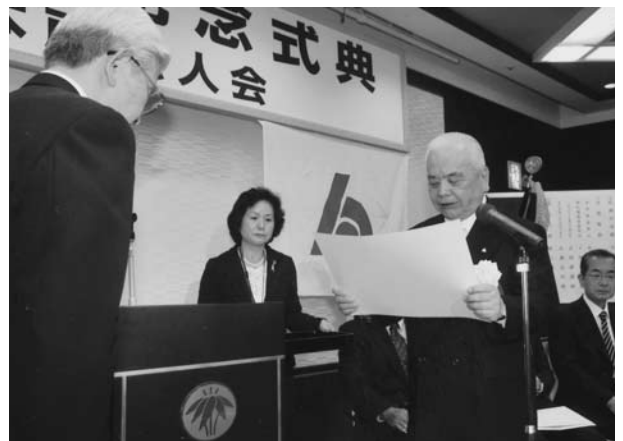
立岡会長より感謝状の贈呈