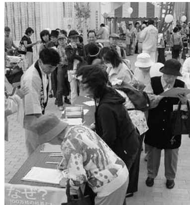
社会貢献活動風景