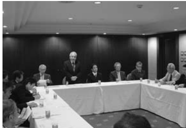
10月8日 第2グループ 於：ザ・ホテルベルグランデ