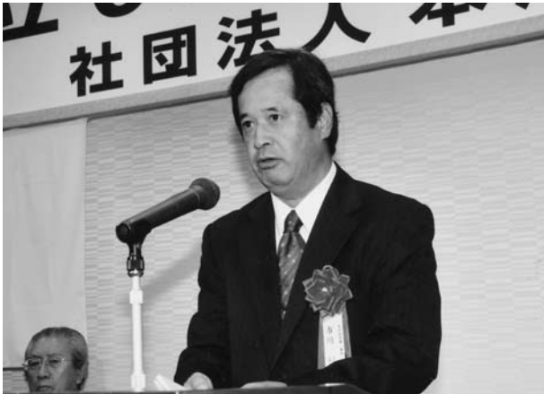
ご祝辞を述べられる本所税務署 市川署長殿