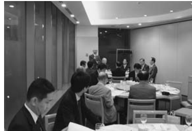
10月6日 第4グループ 於：第一ホテル両国内東天紅