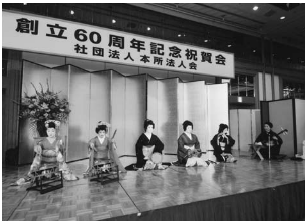
向島芸妓の唄と踊り