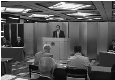
10月5日 第5・6グループ 於：東武ホテルレバント東京

各グループでは、グループ別研修会、会員増強についての役員会を開催。運営に向け協議した。