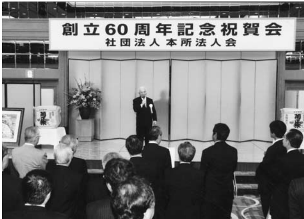
祝賀会会場にてご挨拶の立岡会長