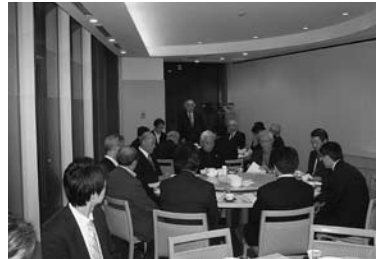
10月25日 第3グループ 於：第一ホテル両国内東天紅